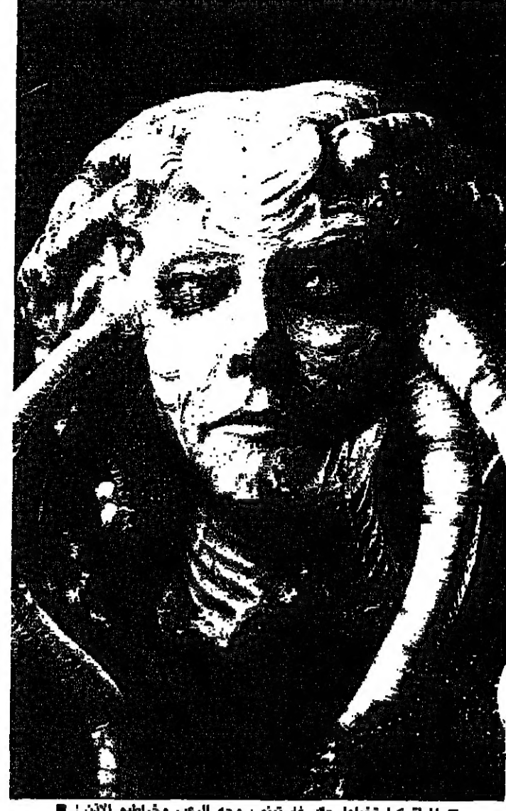
المرأة كما تخيلها جاك غاستينو. وجه الرب وخرابيم الان

بكين تواجه نقصا في خدماتها، وبلغ عدد الخدمات في العاصمة الصينية ٣٦٠٠٠٠ خدمة في وقت يقول فيه مسؤولون ان المدينة تحتاج الى اكثر من مائة ضعف هذا العدد. وقد نشرت الصحافة الرسمية خطابات غاضبة من ازوج يشكون من عدم وجود احد يعتني بتكبير شؤون المنزل وواجبات هذا الطلب تتركز على العاصمة من الريف عدة الاف من النساء الشابات سعيا وراء اجور افضل وتقريب مهني وسعيا وراء عنصر الاثارة. ولكن صحيفة تشينغدينغ وبين النساء الصينيات، تقول ان النقص لا يزال حادا ذلك لان عدد الذين يستطيعون استئجار خادمة اخذ في الازدياد. ويبدو الناس كذلك ان الجدين لم يعودوا يريدان الاعتناء بالانفصال في وقت بات فيه عدد دور الخدمة غير كاف. وهناك فلتان في الوقت ذاته في عدد العمال في المزارع نتيجة الإصلاحات التي تجعل الفلاحين مسؤولين عن ارضهم وبالتالي اكثر انبعاثا للكلفة مما كانوا عليه في الماضي. وتقول جوي بيونغ وهي خادمة تبلغ العشرين قدمت من قرية فقيرة بوانسو الصين، لم يكن هناك فلتان في العمل في قريتي قبل بضع سنوات ذلك لان كل امرئ كان يعمل ويتقاضى لجزءا مهما